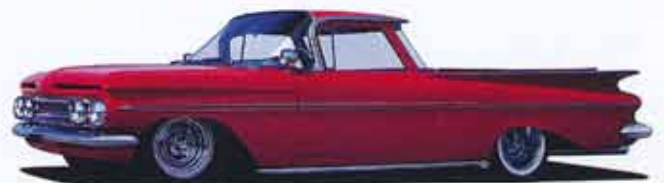
El Camino Chevrolet 1959