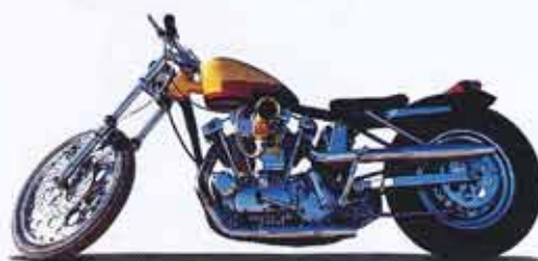
Harley Davidson 1962