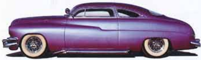
Ford Mercury 1950