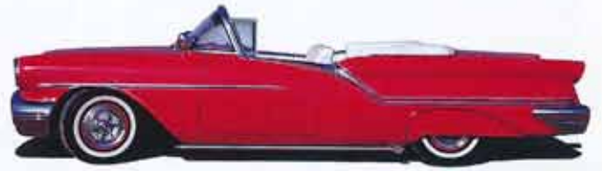
Oldsmobile Convertible 1957