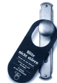
Ohne eine Hausratversicherung kann man nach einem Brand auf der Straße stehen. Und das auch noch ohne Koffer.

„ANGENOMMEN, es hat tatsächlich bei uns gebrannt, und wir können gar nicht mehr zu Hause wohnen. Was dann?“