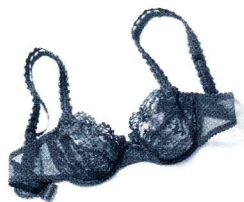
Schlimm genug, wenn wildfremde Menschen in Ihren persönlichen Sachen wühlen ...

Pfffffft. Die Luft ist raus. Nach einem anstrengenden Arbeitstag kriechen Sie sozusagen auf Felgen nach Hause und haben nur noch eins im Sinn: Tiefkühlpizza in den Ofen, Beine hoch und Fernseher an. Doch daraus wird nichts. Denn heute hat Ihnen jemand einen Strich durch die Rechnung gemacht.