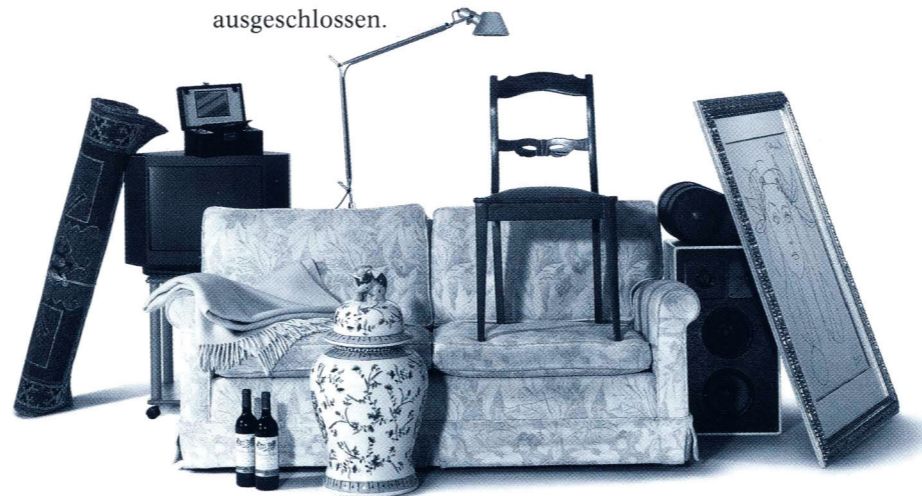
Vom Rotwein bis zum roten Sofa, vom Fernseher bis zur Blumenvase: Im Falle eines Falles ersetzen wir fast alles.

„ANGENOMMEN, es hat tatsächlich bei uns gebrannt, und wir können gar nicht mehr zu Hause wohnen. Was dann?“