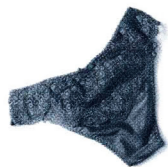
Unsere Hausratversicherung ersetzt Ihnen wenigstens den materiellen Schaden.

Das fängt schon mal damit an, dass der Fernseher nicht mehr da ist – ebenso wie alles andere, das ein paar Mark wert, handlich und leicht zu transportieren war: Ihre Videokamera, Ihre Hi-Fi-Anlage, Ihr PC, der Schmuck Ihrer Oma ... Selbst die Bargeldreserve im Spezialversteck haben die Ganoven entdeckt! Bei ihrer Suche haben sie alles aus den Regalen gerissen, und was einstmals Ihr gemütliches Zuhause war, gleicht in diesem Moment einem riesengroßen Haufen Müll. Tja.