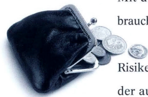
Wenn Sie allein leben, ist dieser Basisschutz genau das Richtige für Sie.