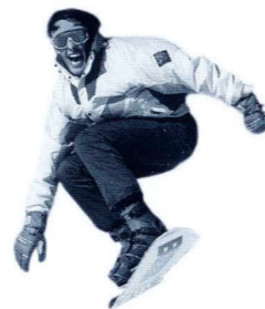
Was soll schon passieren? Meistens gar nichts. Aber was ist, wenn doch?

Unser Versicherungspaket für Singles macht es Ihnen leicht, Ihre Lebenssituation mit einem vernünftigen Maß an finanzieller Sicherheit abzulockern.