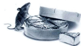
Unser Versicherungspaket ist speziell auf Singles zugeschnitten. Besonders im Preis.

Übrigens: Alle Bausteine dieses Pakets können Sie sehr günstig auch einzeln abschließen und später Ihrem veränderten Bedarf anpassen. Nur für den Fall, dass Sie sich doch noch irgendwann für die Familienpackung entscheiden.