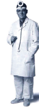
Wenn Sie später mehr Geld haben, können Sie Ihre Versicherung einfach umtauschen und zu einer Kapitallebensversiche- rung machen. Ohne erneute Gesundheitsprüfung.

Gleichzeitig bleibt Ihre Familie weiterhin abgesichert, genau wie in den Jahren davor. Dafür hat sich das Ganze doch gelohnt, oder?