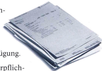
Miete oder Kreditraten, Essen, Kleidung, Strom und Telefon ... Wer soll all das bezahlen, wenn der Hauptverdiener plötzlich ausfällt?

„FINANZIELL sieht's aber bei uns zur Zeit richtig eng aus. Wie soll ich da noch meine Familie absichern?“